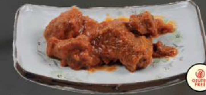
35. Daging Seraki Pedis (Gesmoord rundvlees) | €10,25