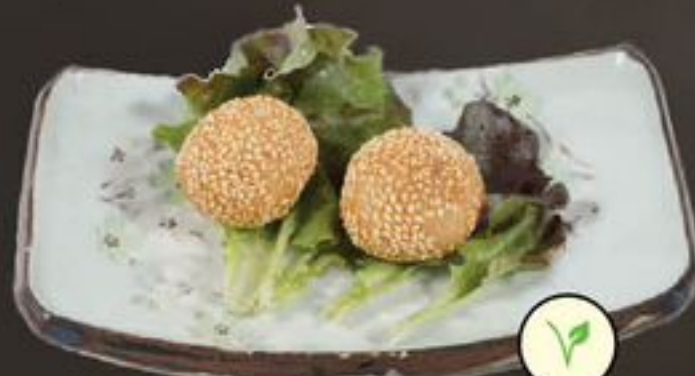
56. Sesameballs & Lotus (Veg. lotus- & sesampasta) | €4,00