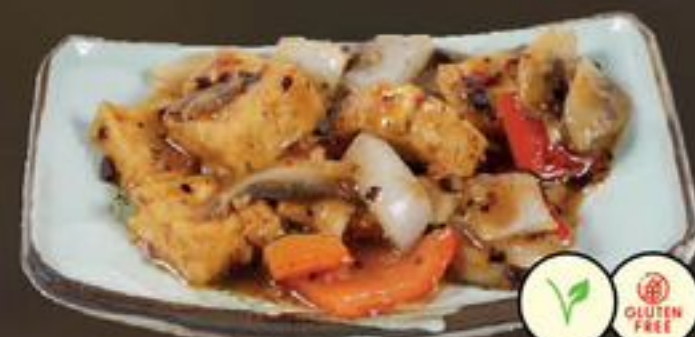
50. Tsi Chiu Tofu (Tofu met zwartebonensaus) | €18,00