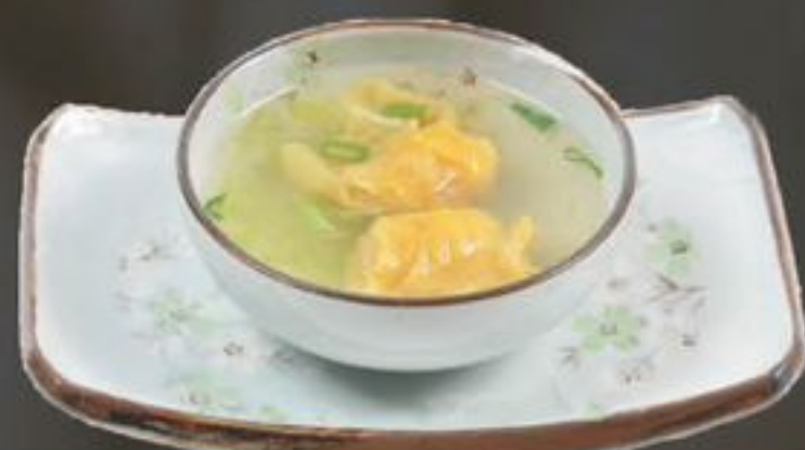
3. Seu Kau Soup (Garnalenflensjes) | €6,50