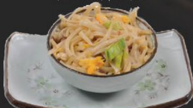
48. Noodles (Bami) | €2,50