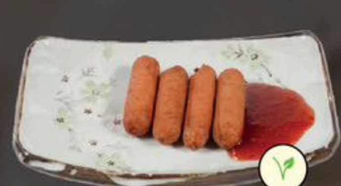
57. Vegetarian Sausages (Vegetarische Chinese worstjes) | €3,75