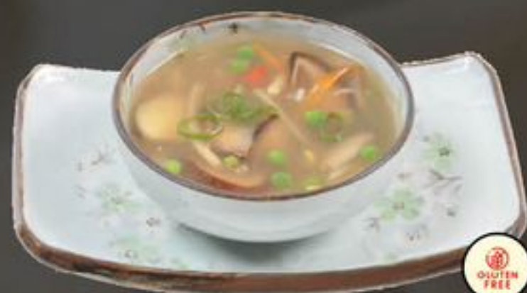
1. China Fantasy Soup (Soep van het huis) | €5,25