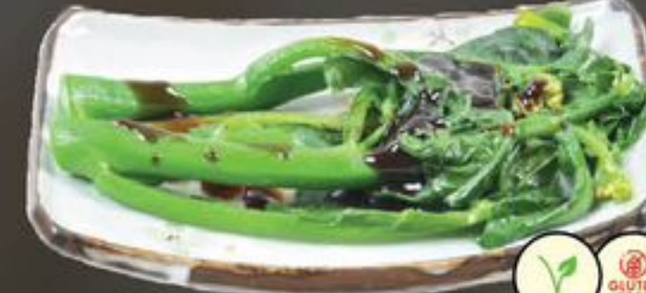
37. Kai Lan (Chinese broccoli) | €9,50