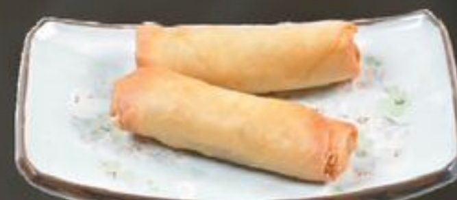
14. Cha Goa (Vietnamese loempia) | €5,75