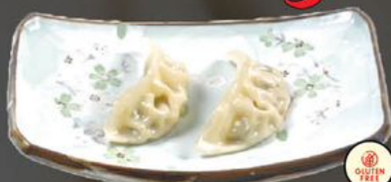
5. Ha Kau (Gestoomde garnalenpastei) | €4,00