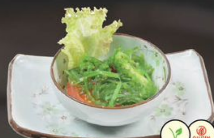
40. Chuka Wakame (Japanse Zeewiersalade) | €5,75