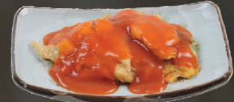
36. Foe Yong Hai (Omelet) | €13,50