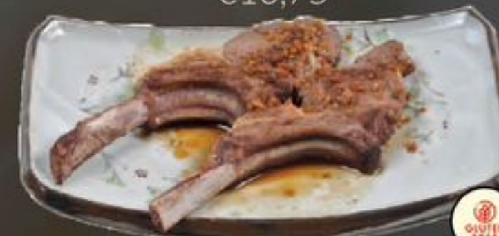
27. Yeung Pha (Lamskoteletten) | €14,00