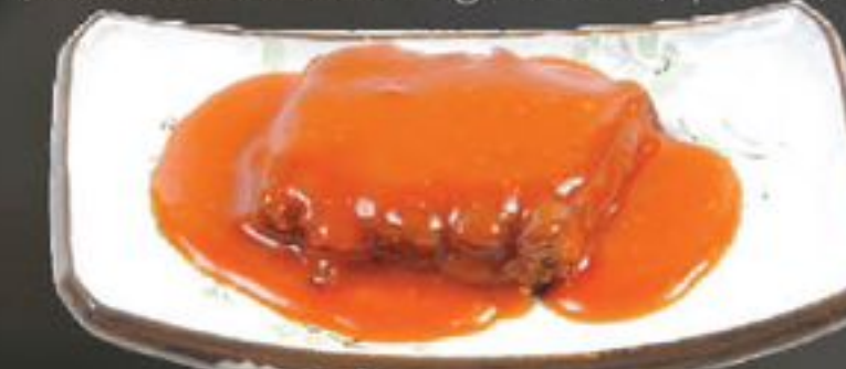
30. Babi Pangang (Mager varkensvlees) | €9,75