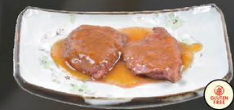
34. Gyu Uniku (Ossenhaas met teriyakisaus) | €13,50