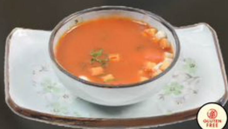
2. Tomato Soup (Tomatensoep) | €4,00