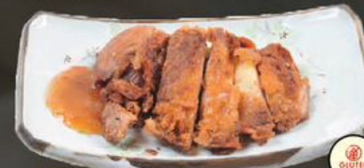
29. Kwa Loo Ap (Geroosterde pekingeend) | €12,50