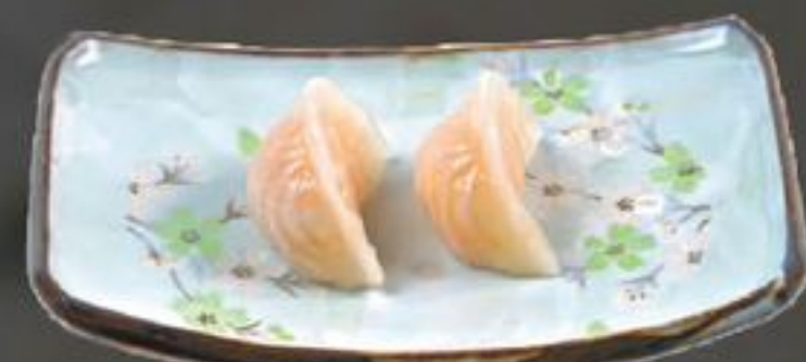
7. Gyoza (Gegrilde vleespastei) | €4,00