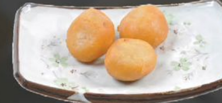
32. Koe Loe Yuk (Varkensvlees in deeg) | €9,75