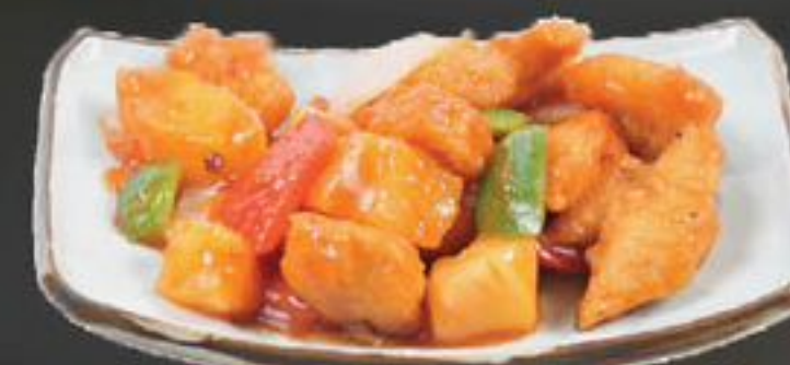
25. Sang Tjau Kai (Kip met ananas in zoetzure saus) €10,75