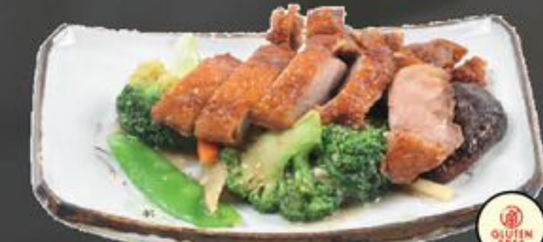
28. Saam Sin Ap (Eend met seizoensgroenten) | €12,50