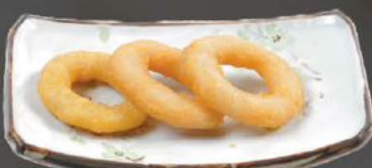
12. Ika Rings (Inktvisingen) | €3,95