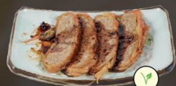
53. Vegetarian Peking Duck (Vegetarische Pekingeend) | €10,50