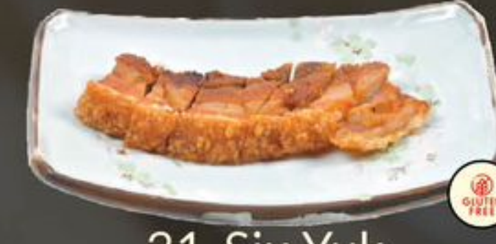
31. Siu Yuk (Geroosterde speenvarken) | €9,75