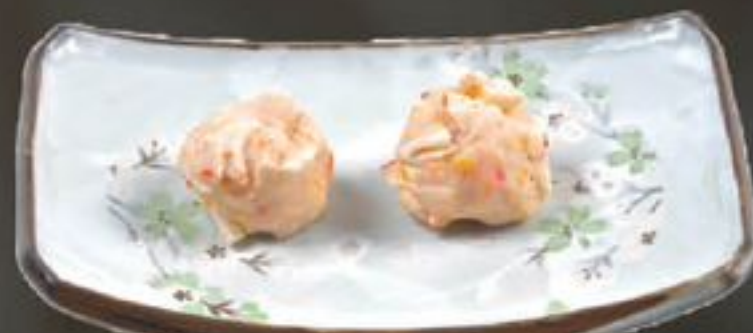
8. Long Ha Yuen (Kreeftenpastei) | €4,00