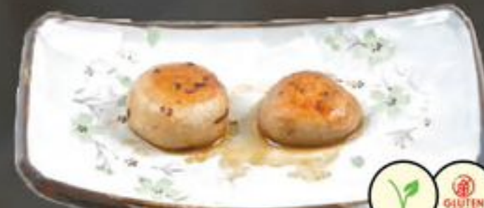
18. Mushrooms (Champignons) | €3,95