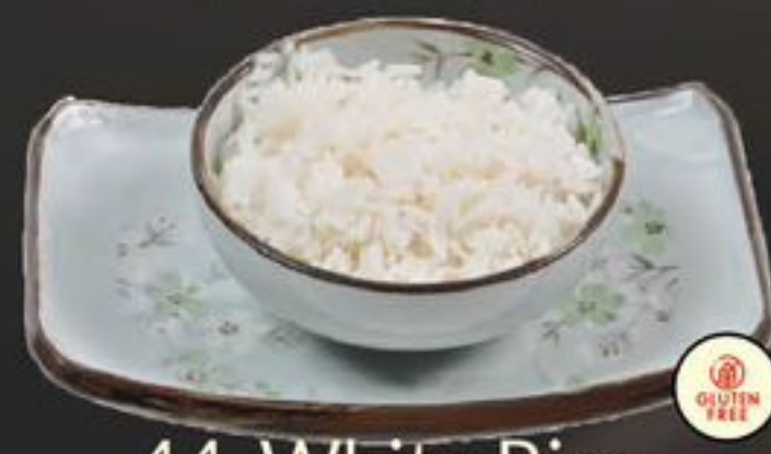
44. White Rice (Witte Rijst) | €2,50