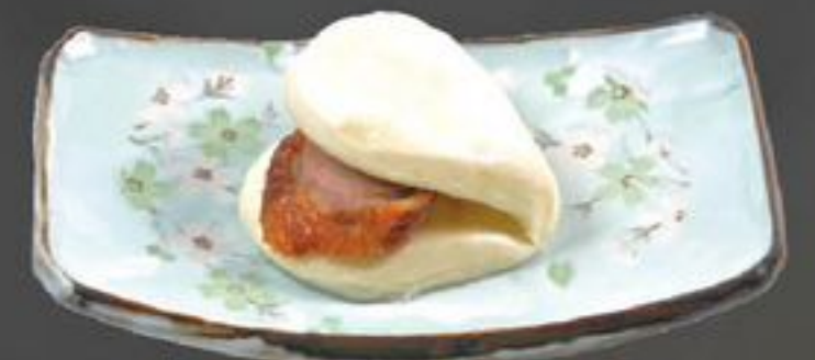
11. Hon Son Ap Pao (Broodje met pekingeend) | €4,75