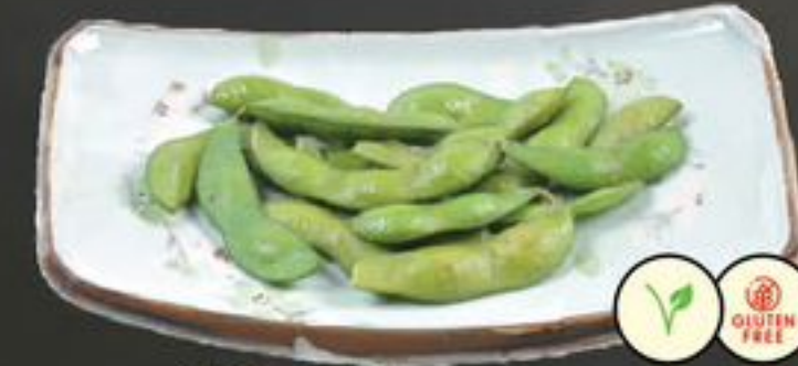
19. Edamame (Sojabonen) | €4,00