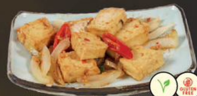
51. Tsiu Yim Totu (Vegetarische kip) | €9,00