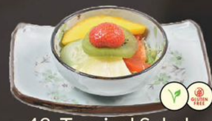
43. Tropical Salad (Verse Fruitsalade) | €5,75