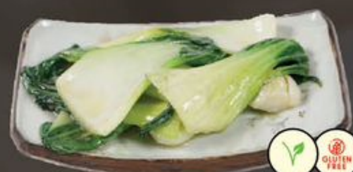
55. Pak Choi (Vegetarische Shanghai Pak Choi) | €9,50