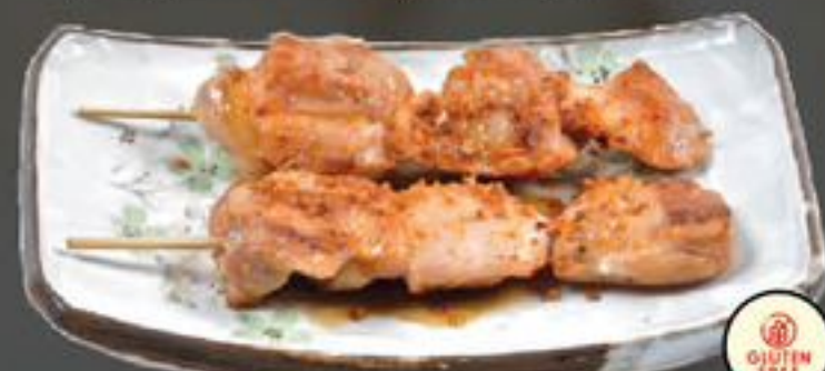
9. Sate Teriyaki (Kip op spies) | €4,00