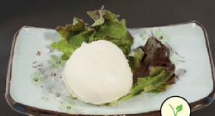
58. Custard Bun (Custardbroodje) | €3,75

U kunt per persoon maximaal 3 items per ronde bestellen van onze kaart.