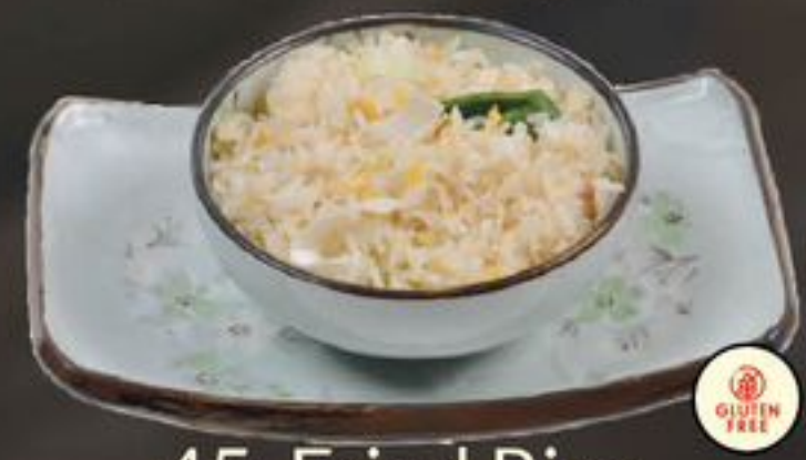
45. Fried Rice (Nasi) | €3,50