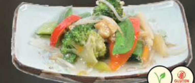
38. Tjap Tjoi (Groenten) | €9,00