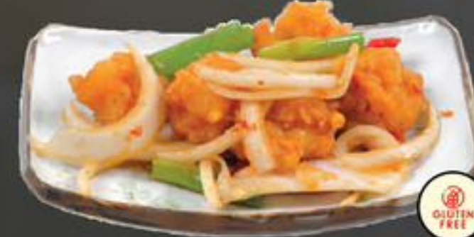
22. Tsiu Yim Ha (Garnalen met verse kruiden Canton) €13,00