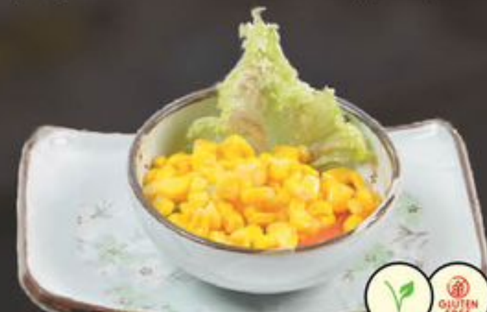
42. Corn Salad (Maïssalade) | €5,75