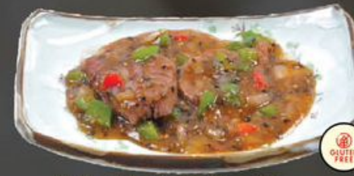
33. Hak Tsiu Ngau (Ossenhaas met pepersaus) | €13,50