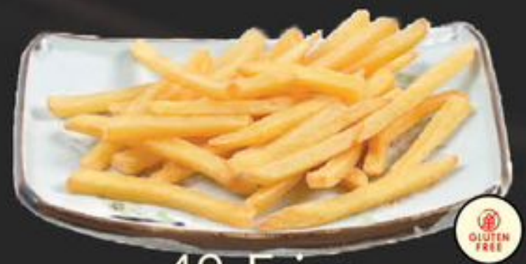
49. Fries (Patat) | €2,50