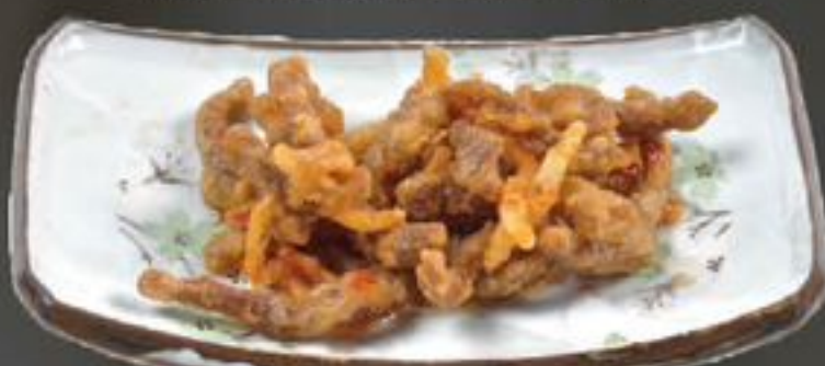
10. Kon Pin Ngau (Biefreepjes met honingsaus) | €8,75