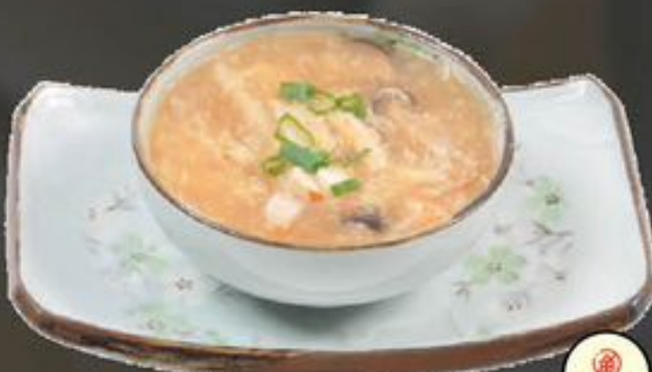
4. Sun La Thong (Pikante zure soep) | €5,25