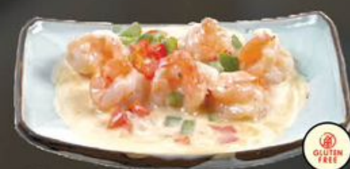
21. Ming Ha Fantasy (Garnalen met Chinese cocktailsaus) €13,00