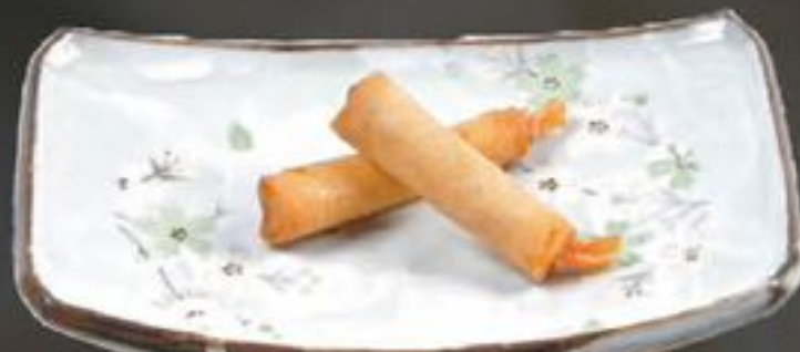
15. Fung Me Ha (Krokant gebakken garnalen) | €3,95