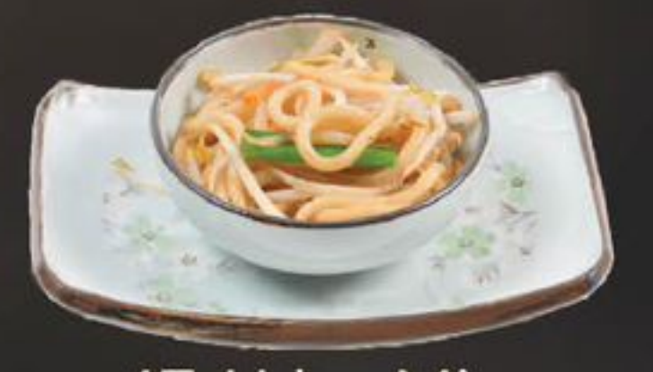
47. Udon Mie (Japanse Bami) | €4,50