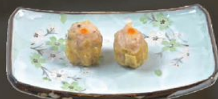
6. Siu Mai (Gestoomde vleespastei) | €4,00