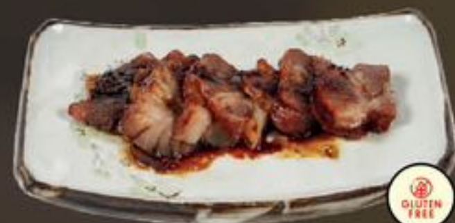
39. Tsa Siu (Geroosterd Varkensvlees) | €10,75