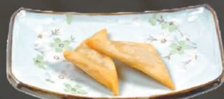
13. Kerry Ko (Kerrie driehoekjes) | €3,95