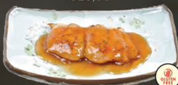
23. Panga fillet (Pangafillet) | €9,00