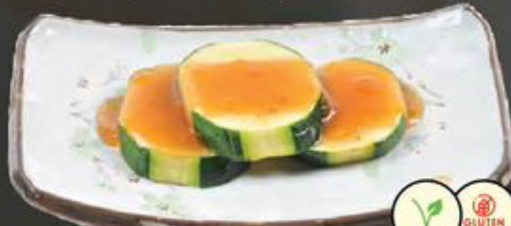
17. Zukki-Ni (Courgette) | €4,00