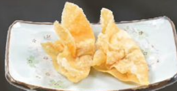
16. Pangsit Goreng (Gefrituurde wonton) | €3,95