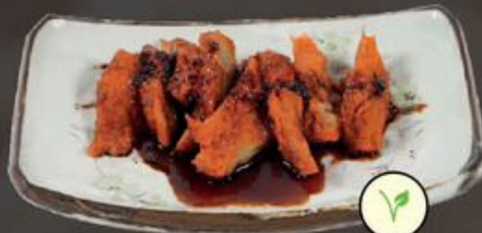
54. Vegetarian Tsa Tsiu (Vegetarisch varkensvlees) | €10,50