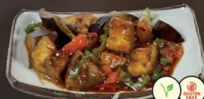
52. Yu Zian Eggplant (Aubergine met Tofu) | €8,00