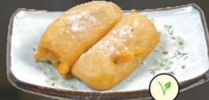
20. Pisang Goreng (Gebakken banaan) | €3,95