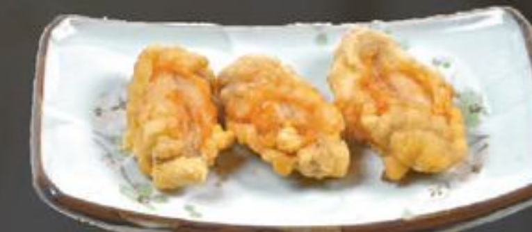
26. Tempura Wings (Tempura vleugels) | €3,95