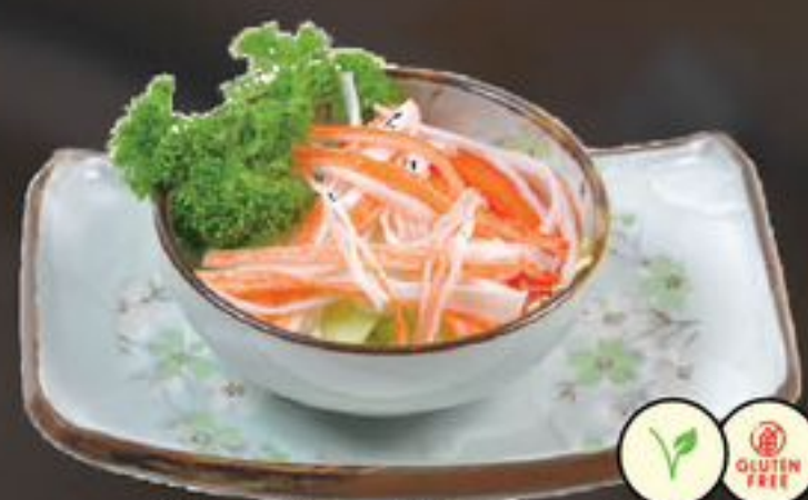
41. Kani Sarada (Krabsalade) | €5,75