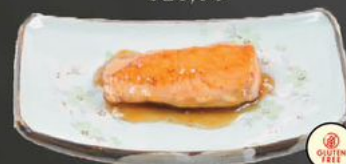
24. Salmon fillet (Zalmfilet) | €10,00